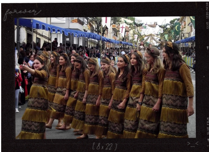
Primera vez saliendo en las Fiestas de Moros y Cristianos con mis amigas 14/9/2019