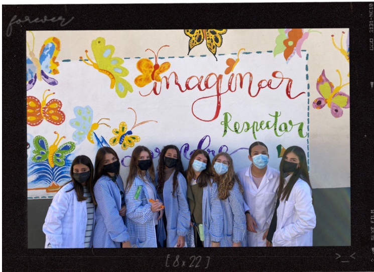
Junto a mis compañeras de clase tras el festival navideño 21/12/2021