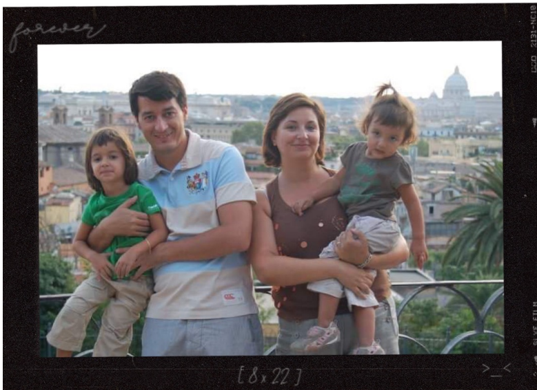
Segundo viaje en avión de mi vida, a Roma, Italia. 13/9/2009