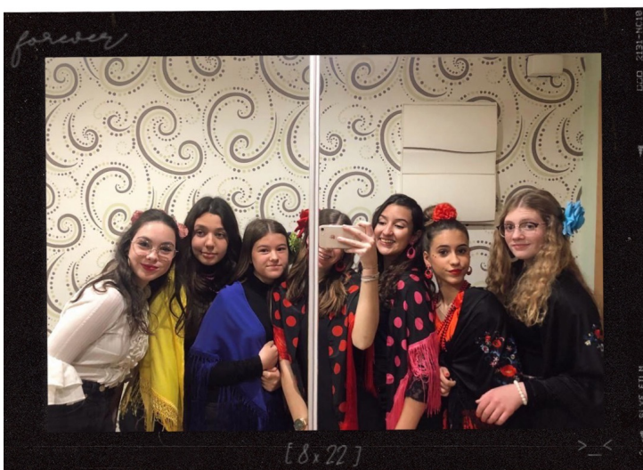
Último carnaval junto a mis amigas 26/2/2022