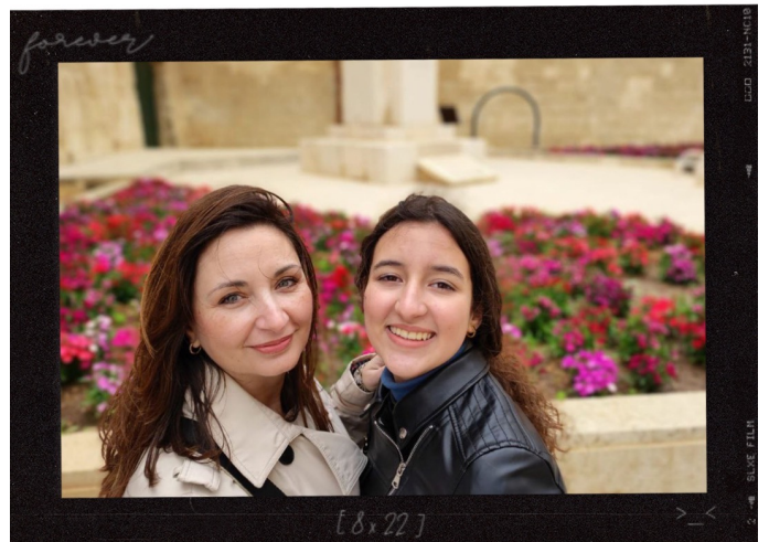
Mi viaje más reciente de las últimas Pascuas, Valletta en Malta 15/4/2022