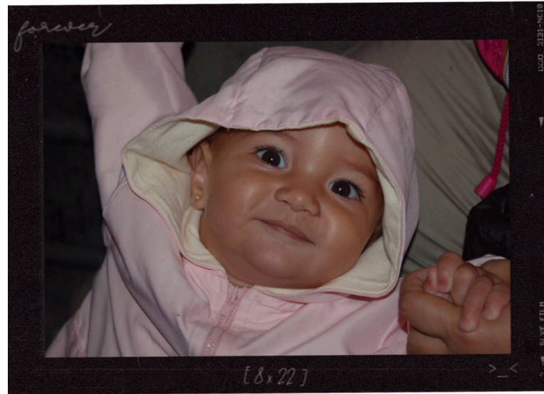
Mi primer viaje fuera de España, Florencia (Italia) 14/9/2008