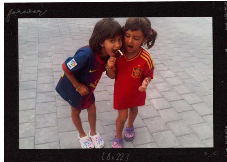
Veraneando en Almería, Cabo de Gata 18/7/2010