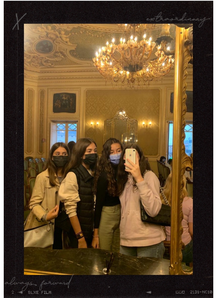
Primer viaje fuera de España junto a mis amigas en el Erasmus 21/10/2021