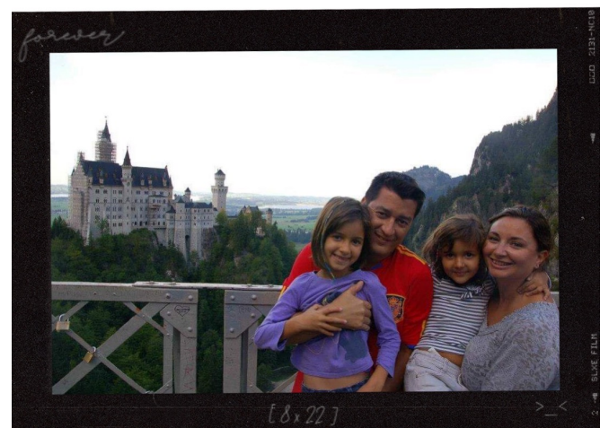
Visitando el Castillo de Neuschwanstein en Alemania 11/9/2012