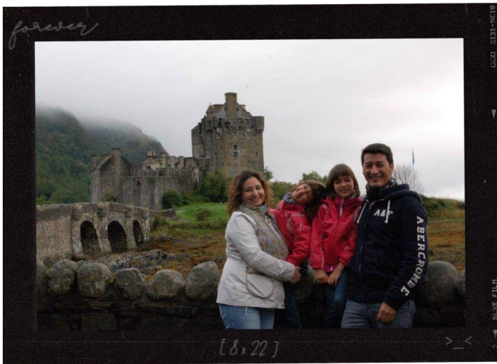
Foto familiar en el Castillo de Eilean Donan, Escocia 15/9/2013