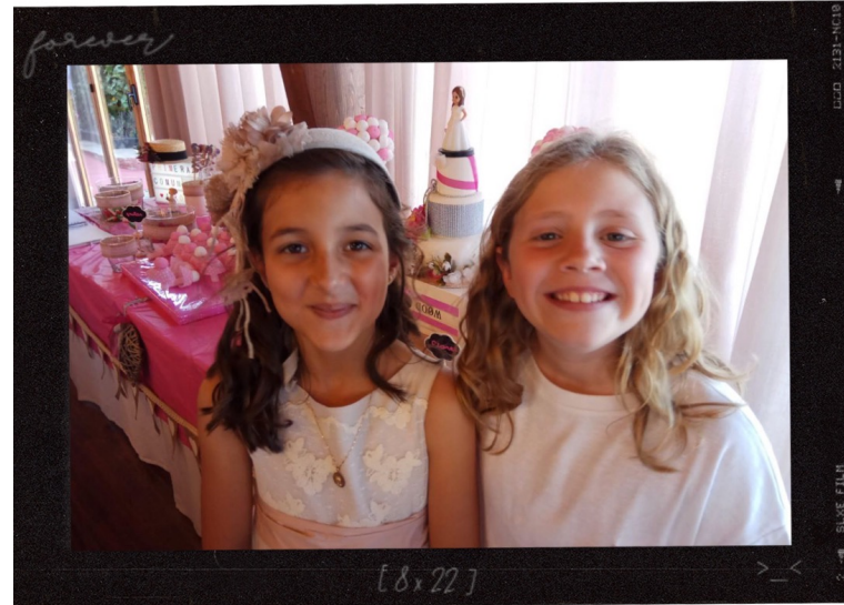
Mi primera comunión, junto a mi mejor amiga Mar 28/5/2017