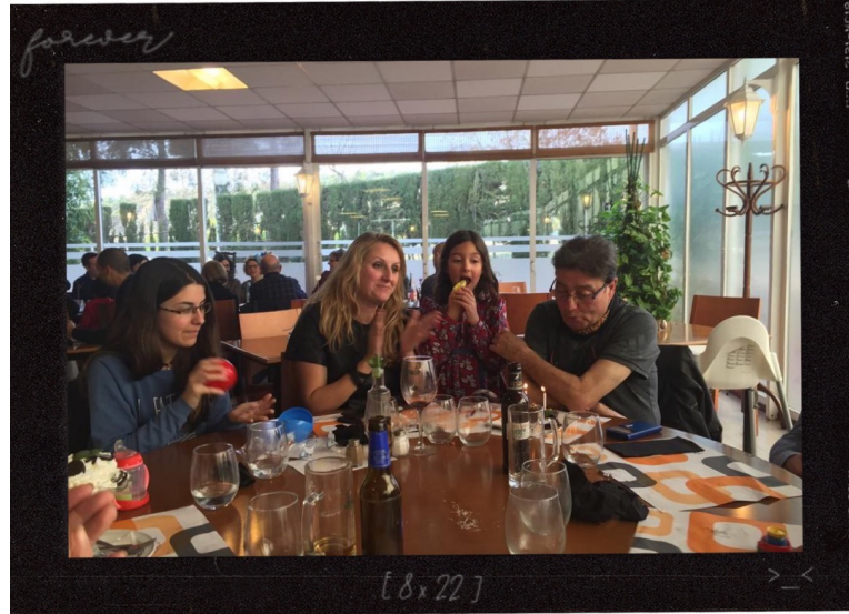
Reunión familiar semanal de los domingos para ir a comer 17/3/2014